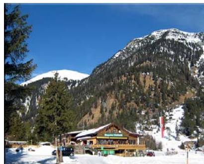
und die Pletzachalm im Karwendel

Sie fahren mit dem Auto bis nach Pertisau, gleich am Ortsanfang links einbiegen zur Talstation, geradeaus weiterfahren bis ganz hinten, wo die Parkplätze für den Naturpark Karwendel sind. Lassen Sie dort das Auto stehen. Nun können Sie ganz eben 1 h bis zur Falzthurnalm gehen oder zur Pletzach. Auf dem Weg zur Pletzachalm müssen Sie Acht geben, da geht nach ungefähr 1 km links in den Wald hinein der Weg rauf auf die Feilalm. 1 h 30 Minuten durch den Wald auf einem schönen Weg erreichen Sie eine meiner Lieblingshütten, die Feilalm. Der Blick ist gigantisch, sollen Sie nicht versäumen. An der Hütte geht die Straße weiter, auf der Sie auch Richtung Tal wieder zum Parkplatz kommen.